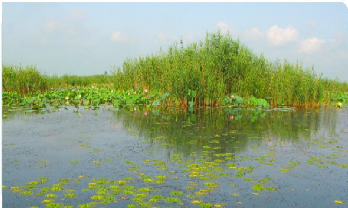
تالابها؛ زیستگاههایی پیچیده و حیاتی

اتحادیه بینالمللی حفاظت از طبیعت و منابع طبیعی (IUCN) در کنوانسیون بینالمللی تالابها تعریف زیر را برای تالاب ارائه نموده است: