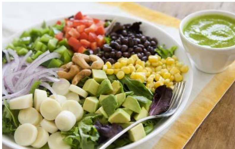
شما در حال حاضر گیاه خوار هستید یا خام خوار؟